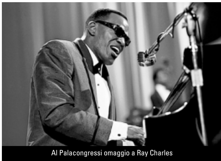
Al Palacongressi omaggio a Ray Charles

Sabato 25 marzo al Palacongressi di Lugano si terrà il musical One night of Ray Charles - Il genio del soul (con il cast originale accompagnato da una grande orchestra) che si presenta con un emozionante viaggio nella vita e nella carriera di un mito della musica soul: chi ha già avuto modo di vedere questo spettacolo assicura che si tratta di ben più che un semplice musical.